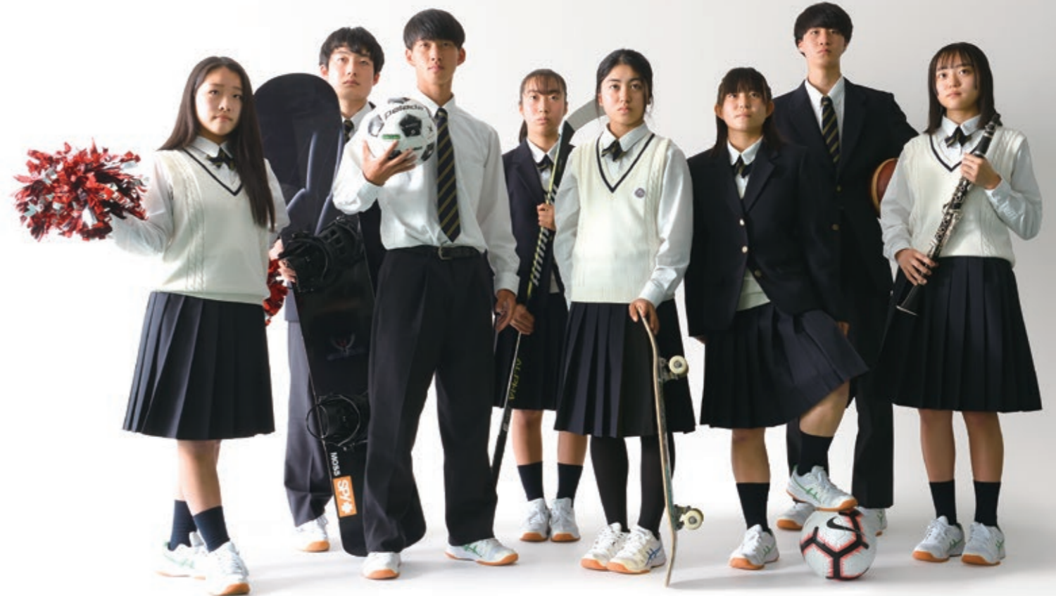
(ダンス・スノーボード・カターレ富山・アイスホッケー・スケートボード・女子サッカー・富山グラウジーズ・吹奏楽 他)

本校は、校外での活動においても、 アスリートの育成や文化・芸術分野で 頑張っている生徒を応援しています。 富山県全体を活気づけられるよう、 若い力の活躍を全国に発信するとともに、 奨学金制度を導入しサポートしています。