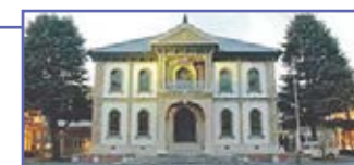
歴史と伝統の「龍谷大学」大宮キャンパス

※「龍谷総合学園」とは、浄土真宗本願寺派の関係学校法人によって構成されている組織です。